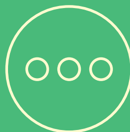
... und viele weitere Faktoren