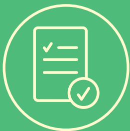
Bezahlte AHV- Beiträge